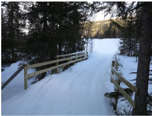
Ny bru Bryggfielldalen

Ny høringsrunde med klagefrist 3. desember 2015, ved fristens utløp var det kommet 3 nye klager.